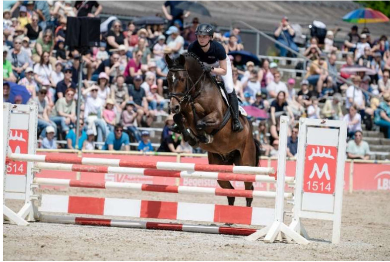
Ein Publikumsmagnet: das Schauprogramm am Kindertag